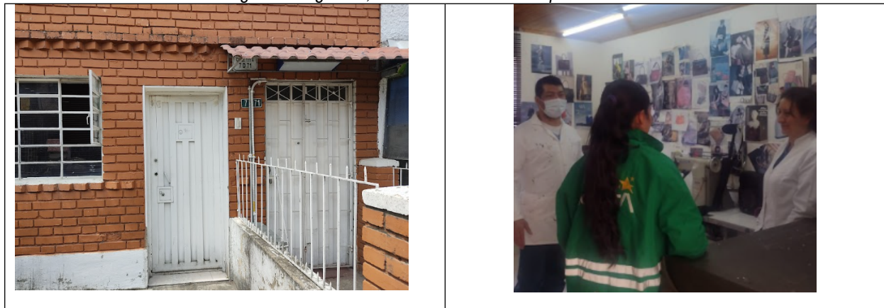
Tabla 9. Registro fotográfico, visita realizada a la empresa ALFREDO TOBÓN.

A continuación, se presenta parte del registro fotográfico realizado durante la visita realizada a la empresa ALFREDO TOBÓN: