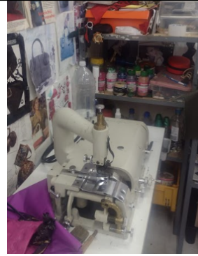
Foto 2. Visita realizada para la renovación del permiso de aprovechamiento de fauna silvestre